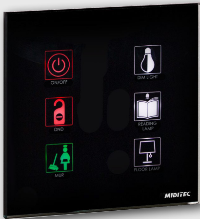
HC3506 Bedside Panel Licht- und Raumsteuerung Lighting and room control