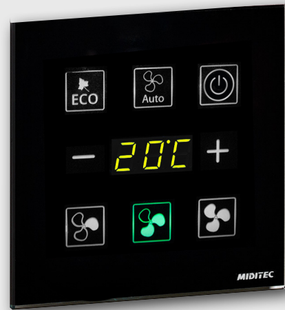
HC3530 Temperature Control Temperatur- und Lüftersteuerung Temperature and fan control